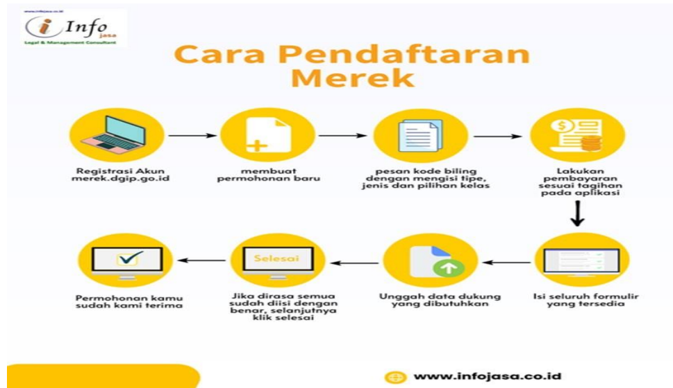
Gambar 4 Flowchart Cara Pendaftaran Merek

Pendaftaran merek adalah langkah penting untuk melindungi identitas produk Anda. Berikut adalah langkah-langkah untuk mendaftarkan merek. Penjelasan cara pendaftaran merek di atas dapat diuraikan sebagai berikut: