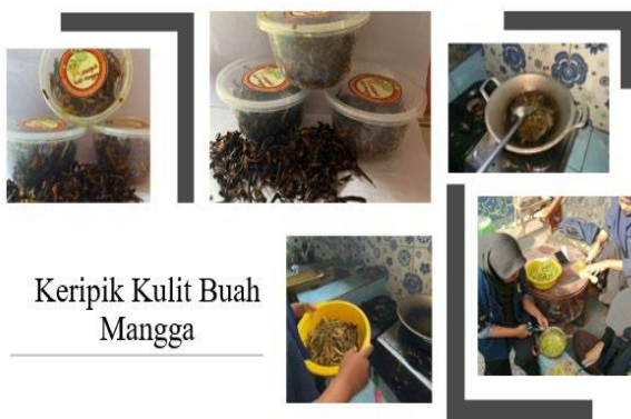
Keripik Kulit Buah Mangga

Gambar 3 produk keripik kulit mangga juga menjadi inovasi menarik yang dikembangkan oleh pelaku usaha. Keripik ini dibuat dari kulit mangga yang biasanya dibuang, dan diproses menjadi camilan yang renyah.