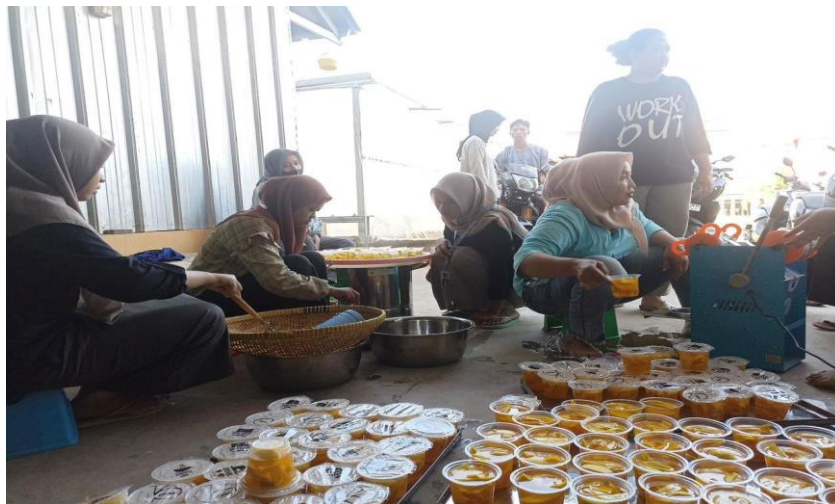
Kegiatan Ibu-Ibu PKK dan Kelompok Tani Mangga Sari Desa Belawa

Kegiatan dalam gambar di atas ini, tidak hanya memberikan keterampilan baru, tetapi juga membangun solidaritas antar anggota PKK dan membuka peluang untuk sebagai pelaku usaha baru. Harapan Olahan mangga dari Desa Belawa bisa dikenal luas dan meningkatkan pendapatan keluarga tanpa mengesampingkan mengenai perlindungan hukum terhadap olahan mangga tersebut.