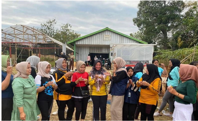
Gambar 2 Kegiatan wawancara dan Diskusi

Kegiatan tidak hanya berhenti di olahan mangga saja, dilanjutkan dengan sosialisasi mengenai pentingnya perlindungan hukum dengan mendaftarkan merek, kegiatan wawancara disertai dengan diskusi bersama ibu-ibu PKK dan kelompok Tani Mangga Sari desa Belawa, dapat dilihat pada gambar 2 berikut ini: