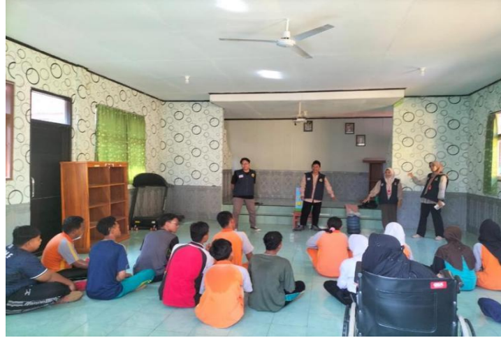
Gambar 1. Pemaparan Materi oleh Tim Mahasiswa KKN

Setelah itu, dilakukan demonstrasi langsung mengenai cara memisahkan sampah organik dan anorganik menggunakan media pembelajaran yang telah diberi label berbeda. Selama demonstrasi, siswa-siswi terlibat secara aktif dengan mencoba memilah sampah yang diberikan oleh fasilitator ke dalam tempat sampah yang sesuai. Keterlibatan langsung ini bertujuan untuk memberikan pengalaman belajar yang praktis dan menyenangkan. Kegiatan ini dapat dilihat pada gambar 2 di bawah ini :