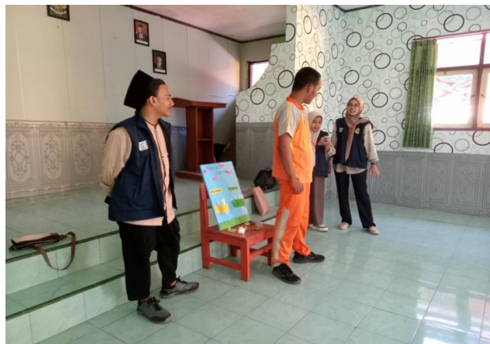
Gambar 2. Penjelasan Klasifikasi Sampah Organik dan Non-organik

Setelah itu, dilakukan demonstrasi langsung mengenai cara memisahkan sampah organik dan anorganik menggunakan media pembelajaran yang telah diberi label berbeda. Selama demonstrasi, siswa-siswi terlibat secara aktif dengan mencoba memilah sampah yang diberikan oleh fasilitator ke dalam tempat sampah yang sesuai. Keterlibatan langsung ini bertujuan untuk memberikan pengalaman belajar yang praktis dan menyenangkan. Kegiatan ini dapat dilihat pada gambar 2 di bawah ini :