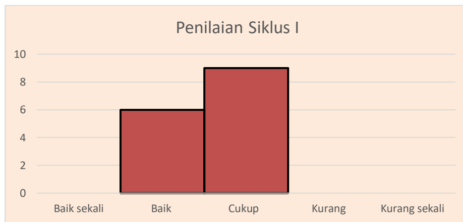
Gambar 2 Deskripsi Norma Penilaian Siklus I

Norma penilaian yang diperoleh siswa pada siklus I berkategori baik sebanyak 6 siswa atau 40%, kategori baik dan kategori cukup sebanyak 9 siswa atau 60%. Dalam bentuk histogram maka data tersebut sebagai berikut: