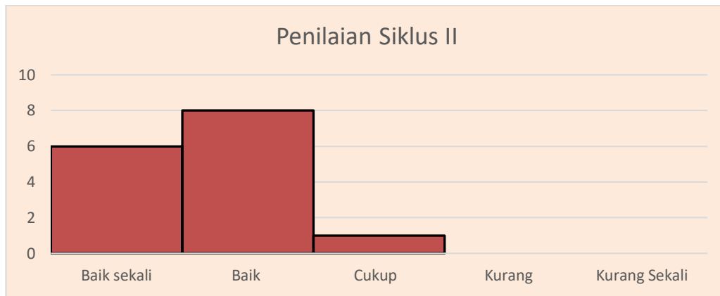
Gambar 3. Deskripsi Norma Penilaian Siklus II