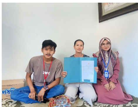
Gambar 2. Pendampingan Pembuatan NIB

Sosialisasi yang dilakukan merujuk pada akses legalitas go formal dengan pembuatan nomor induk berusaha (NIB), sebanyak 60% pelaku usaha belum faham dan belum memiliki akses legalitas usaha, oleh karena itu diberikan pemahaman dan didampingi dalam pembuatan nomor induk berusaha (NIB) agar dapat memperbaiki iklim usaha, meminimalkan birokrasi, serta didapatkannya manfaat bagi pelaku usaha di Indonesia dengan membuat proses pendirian dan pengelolaan usaha menjadi lebih efisien dan transparan. Penulis melakukan literasi digital dengan mensosialisasikan pentingnya legalitas usaha untuk pelaku usaha dalam menghilangkan praktik-praktik ilegal dan informal yang dapat merugikan pelaku usaha, masyarakat, dan pemerintah. Selain itu, penulis juga melakukan pendampingan pembuatan nomor induk berusaha (NIB) untuk pelaku usaha yang dilakukan pada kegiatan KKN minggu ke-5 di masing-masing rumah pelaku usaha (Gambar 2).