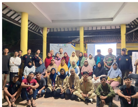
Gambar 1. Kegiatan Sosialisasi Akses Legalitas Usaha

Kegiatan sosialisasi dengan Tema “Perkuat Daya Saing UMKM Dalam Menghadapi Era Society 5.0” bertempat di Aula Desa Keraton, Kecamatan Suranenggala, Kabupaten Cirebon yang dilaksanakan pada tanggal 15 Agustus dengan sasaran pedagang, seperti warung / kedai kelontong, pedagang keliling, dan grosir sebanyak 26 pelaku usaha (Gambar 1).