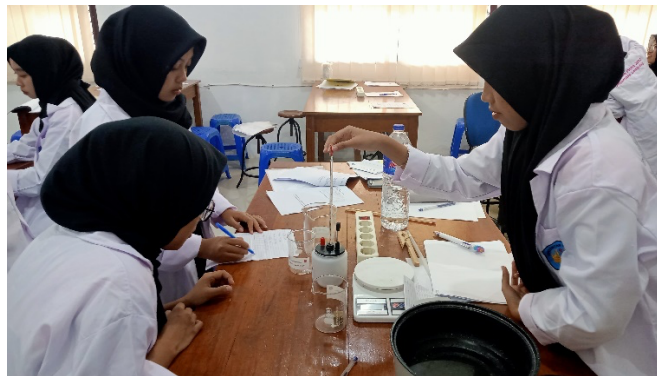
Gambar 3. Mahasiswa teramati bekerjasama dan saling berkolaborasi

Pendekatan dalam panduan praktikum yang berfokus pada hasil, membiasakan mahasiswa untuk berpikir kritis dan berkolaborasi dengan rekan satu kelompok dalam mendapatkan data dan analisis yang ideal. Saat pelaksanaan kegiatan praktikum, mahasiswa teramati bekerjasama dan saling berkolaborasi terutama dalam menentukan prosedur yang tidak tersedia di panduan praktikum, seperti pada Gambar 3. Perlu kesepakatan tim dengan berlandaskan teori untuk menentukan prosedur pengambilan data. Proses ini melatih kemampuan bekerjasama yang merupakan keterampilan penting dalam dunia kerja. Hal ini sejalan dengan hasil penerapan Project-Based Learning (PjBL) dalam konteks OBE, yang menunjukkan bahwa mahasiswa yang terlibat dalam PjBL dapat mengembangkan keterampilan berpikir kritis dan kolaboratif yang penting untuk kehidupan profesional. (Dewi, 2023).